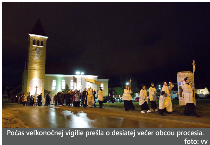
Počas veľkonočnej vigílie prešla o desiatej večer obcou procesia.

Viac o šibačke a oblievačke sa dočítate na nasledujúcej strane.