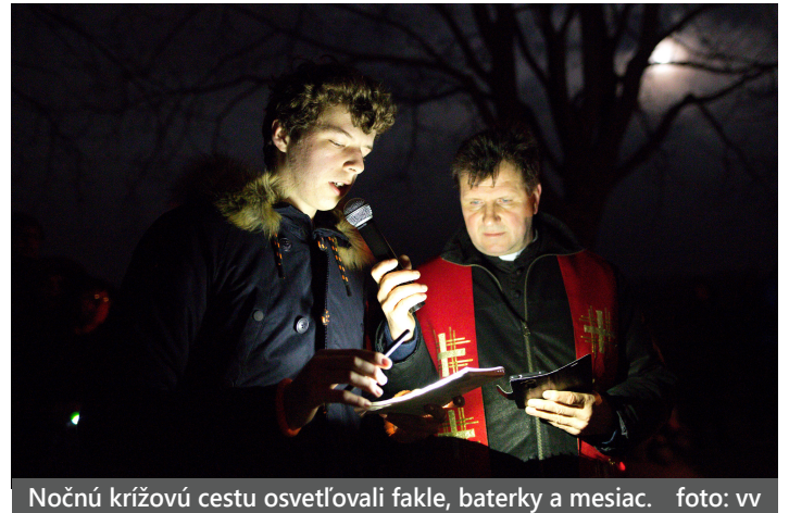
Nočnú krížovú cestu osvetľovali fakle, baterky a mesiac.

O pol ôsmej večer vyrazila z piešťanského Kostola sv. Cyrila a Metoda kresťanská mládež s faklami na Červenú vežu, kde sa o ôsmej hodine začala veľkonoč-