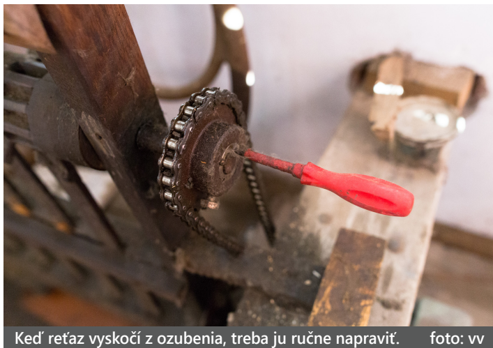
Keď reťaz vyskočí z ozubenia, treba ju ručne napraviť.