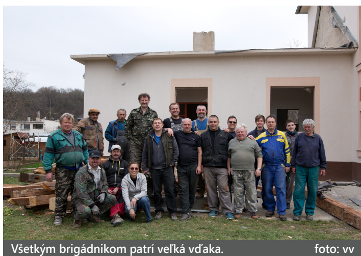
Všetkým brigádnikom patrí veľká vďaka.