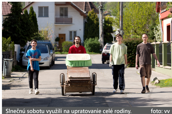
Slnecnú sobotu využili na upratovanie celej rodiny.