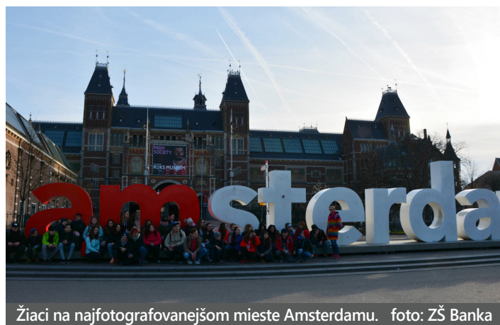
Žiaci na najfotografovanejšom mieste Amsterdamu.

■ Deň narcisov je jedinečná verejnoprospešná zbierka Ligy proti rakovine. Aj tento rok sme sa zapojili do zbierky a podporili tak onkologických pacientov. Na Banke sme vyzbierali 464,69 eur.