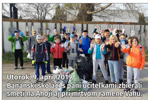
Utorok, 9. apríl 2019 Bananskí školáci s pani učiteľkami zbierali smeti na Ahoji aj pri mŕtvom ramene Váhu.