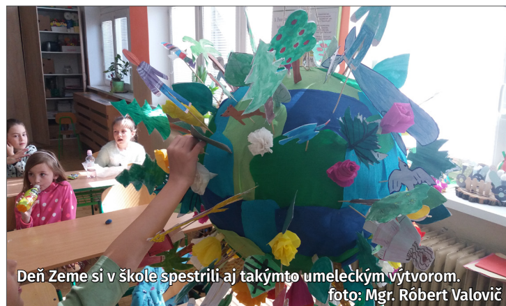
Deň Zeme si v škole spestrili aj takýmto umeleckým výtvarom. foto: Mgr. Róbert Valovič

11. apríl je už niekoľko rokov známy ako Deň narcisov. Ide o jedinečnú verejnoprospešnú zbierku Ligy proti rakovine. Aj tento rok sa do nej zapojili žiaci našej školy. Deviatci chodili s pokladničkou po obci, aby pripomenuli všetkým ob-