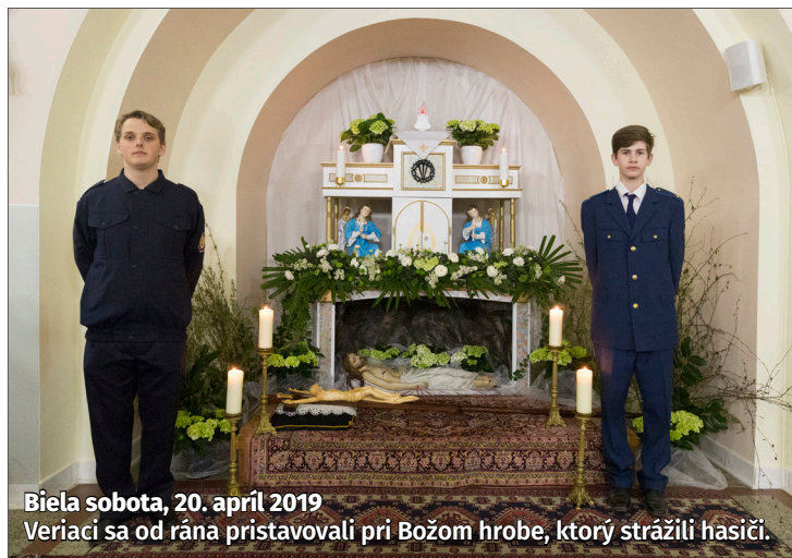
Biela sobota, 20. apríl 2019 Veriaci sa od rána pristavovali pri Božom hrobe, ktorý strážili hasiči.