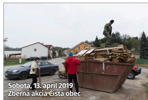
Sobota, 13. apríl 2019 Zberná akcia Čistá obec

S upratovaním v obci pomohli aj miestne organizácie a dobrovoľníci, ktorí vyčistili verejné priestory. Každému z nich patrí naša vďaka!