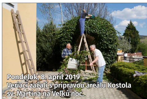
Pondelok, 8. apríl 2019 Veriaci začali s prípravou areálu Kostola sv. Martina na Veľkú noc.

S upratovaním v obci pomohli aj miestne organizácie a dobrovoľníci, ktorí vyčistili verejné priestory. Každému z nich patrí naša vďaka!