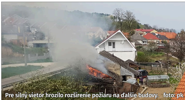
Pre silný vietor hrozilo rozšírenie požiaru na ďalšie budovy.

Deviati členovia DHZ Banka zabezpečovali dopĺňanie cisterien z hydrantu a v spolupráci s policajným zborom regulovali a odkláňali premávku. Úsek cesty vedúcej na Havran musel byť v blízkosti požiariska uzavretý. Vozidlá prichádzajúce od Topolčian ob-