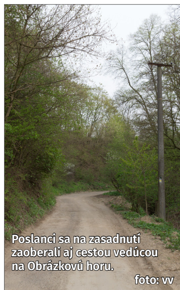
Poslanci sa na zasadnutí zaoberali aj cestou vedúcou na Obrázkovú horu.