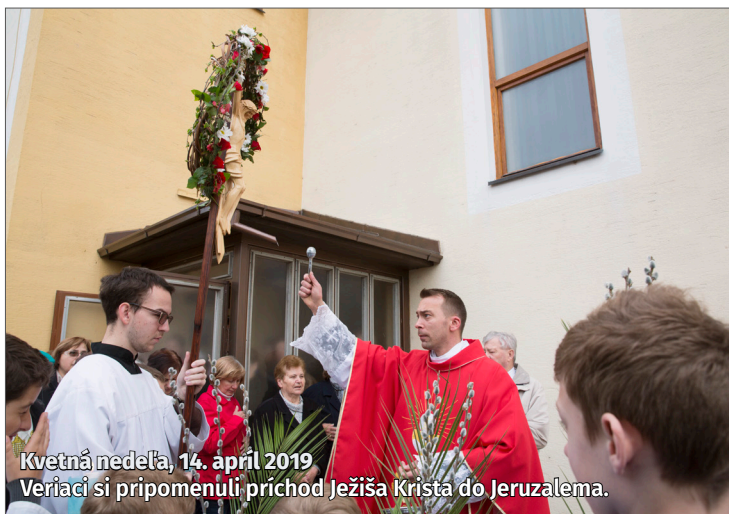
Kvetná nedeľa, 14. apríl 2019 Veriaci si pripomenuli príchod Ježiša Krista do Jeruzalema.

Tento rok pripadla Veľká noc na pomerne neskoré aprílové dni. Veľká noc je najvýznamnejším kresťanským sviatkom, počas ktorého veriaci oslavujú zmŕtvychvstanie Ježiša Krista. Na Zelený štvrtok posledný raz zazneli zvony, ktoré počas nasledujúcich dvoch dní vystriedal rapkáč. Najdlhší obrad zo všetkých, trojhodinová Veľkonočná vigília, sa konal v sobotu večer. Veriaci sa stretli pred kostolom, kde symbolicky zapálili symbol zla – tzv. Judáša. Po zotmení sa rozozneli zvony, ktoré sprevádzali nočnú procesiu po Topoľčianskej, Krátkej a Kamennej ulici.