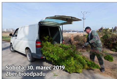
Sobota, 30. marec 2019 Zber bioodpadu