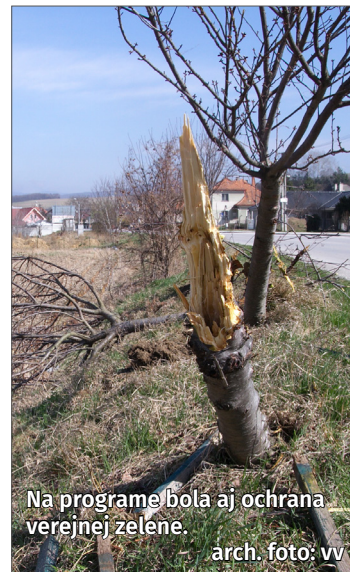
Na programe bola aj ochrana verejnej zelene.

rerova 6, Bratislava (IČO: 35931728) za kúpnu cenu 1 euro; OZ poverilo starostku obce Banka podpísať kúpnu zmluvu ▪ VZN o určení názvu Arménska ulica ▪ zámer odpredať časť pozemku parc. č. 1355/1 zapísaného na LV č. 1300 v k. ú. Banka vo vlastníctve obce Banka podľa §9a ods. 8 písm. e) zák. č. 138/1991 Zb. o majetku obcí v znení neskorších predpisov z dôvodu hodného osobitného zreteľa (na pozemku je umiestnený septik a nie je možné pozemok inak využiť) s výmerou 140 m 2 za cenu 50 eur/m 2 na základe žiadosti majiteľov hotelu Harmónia ▪ zvýšenie ceny stravného lístka pre seniorov na 2,80 eur/obed ▪ investičný zámer Vybudovanie spevnenej prístupovej komunikácie a rozvod inžinierskych sietí na základe žiadosti Ing. Silvestra Tapušíka s podmienkou dodržania stavebného zákona v súčinnosti s príslušnými platnými právnymi predpismi na parc. č. 1419 a 2095/4 registra E-KN vo vlastníctve obce Banka zapísaných na LV č. 1300 na