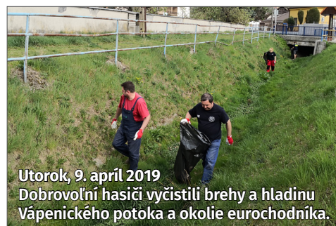
Utorok, 9. apríl 2019 Dobrovoľní hasiči vyčistili brehy a hladinu Vápenického potoka a okolie eurochodníka.