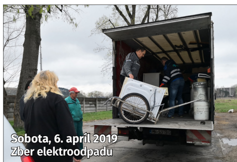
Sobota, 6. apríl 2019 Zber elektroodpadu