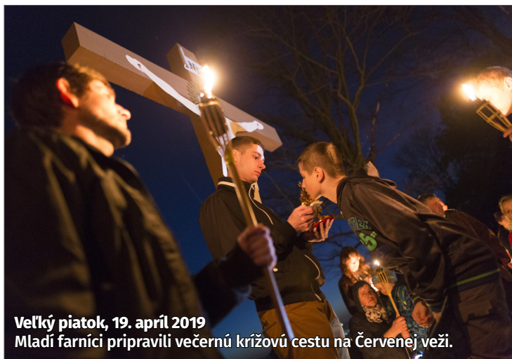
Veľký piatok, 19. apríl 2019 Mladí farníci pripravili večernú krížovú cestu na Červenej veži.