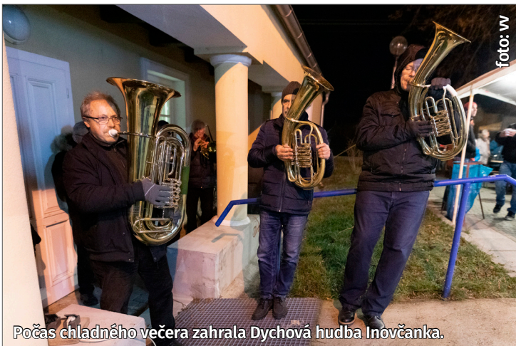
Počas chladného večera zahrála Dychová hudba Inovčanka.