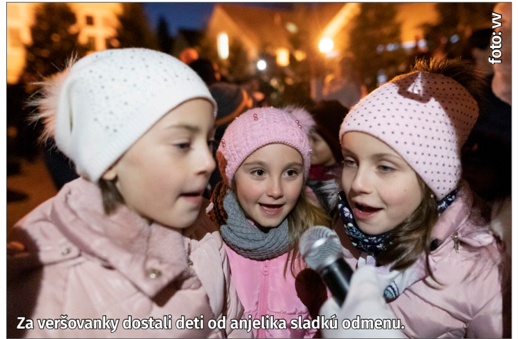
Za veršovanky dostali deti od anjelika sladkú odmenu.