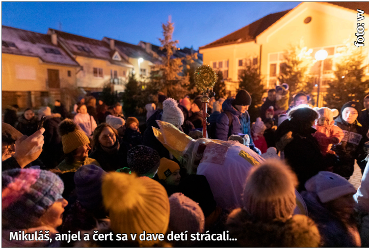
Mikuláš, anjel a čert sa v dave detí strácali...

V stredu 4. decembra podvečer veterné zimné počasie privialo na Banku Mikuláša s anjelom a čertom. Po tom, ako si Mikuláš vypočul básničky, s pomocou detí rozsvietil vianočný stromček. Viac sa dozviete z našej fotoreportáže.