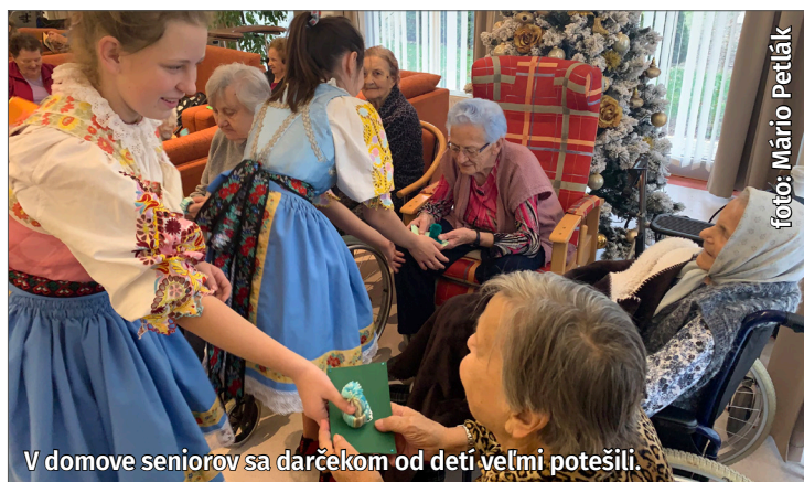
V domove seniorov sa darčekom od detí veľmi potešili.

Ani sme sa nenazdali a Vianoce prišli rýchlym krokom. Koniec roka bol opäť plný podujatí.