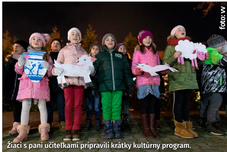
Žiaci s pani učiteľkami pripravili krátky kultúrny program.