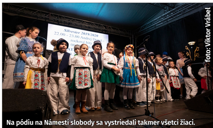
Na pódiu na Námestí slobody sa vystriedali takmer všetci žiaci.