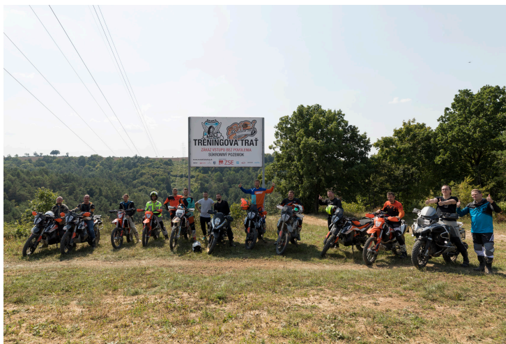
Tréningu sa zúčastnili jazdci z Bratislavy, Ružomberka a Martina. Po lekcii na Banke sa vybrali do Novej Lehoty, kde ich čakala technicky náročnejšia trať.