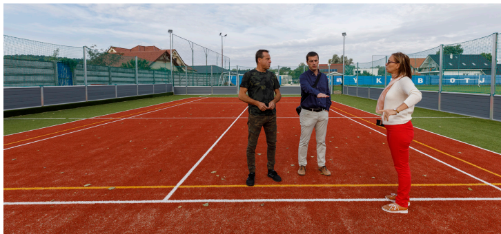
Ihrisko bude počas dňa voľne prístupné. Zahrať si budú môcť deti, dospelí a po dohode so správcom aj športové kluby.