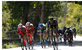
Celkovým víťazom pretekov sa stal Jannik Steimle z belgického tímu Deceuninck – Quick-Step.

Najvýznamnejšie slovenské cyklistické podujatie sa konalo už po šesťdesiaty štvrtý raz. Preteky prebiehali od 16. do 19. septembra. Napriek epidémii sa ich zúčastnilo 177 pretekárov z celého sveta vrátane USA, Izraelu či Ruska. Zastúpenie mali 2 slovenské tímy.