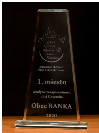
Na úrade pribudla sklenená plaketa.

Reportáž o oceňovaní odvysielala v rovnaký deň Rádio Regina. „Snažíme sa vychádzať občanom