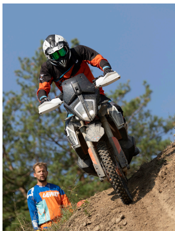
Niektorí motocyklisti si vyskúšali aj zjazd strmým svahom, počas ktorého tuhla krv v žilách...