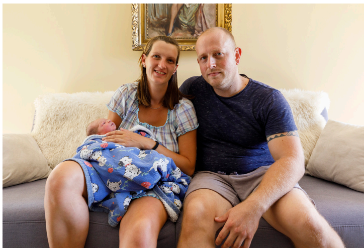
Rodine prajeme veľa zdravia a veselých okamihov.