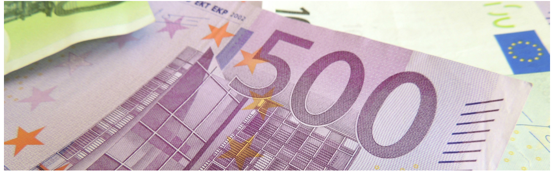
Vplyvom epidémie klesli našej obci dane z príjmov fyzických osôb o viac ako 35-tisíc eur.

Dňa 17. septembra 2020 sa konalo 22. zasadnutie obecného zastupiteľstva obce Banka, ktoré: