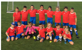
Futbalisti po zápase v Červeníku.