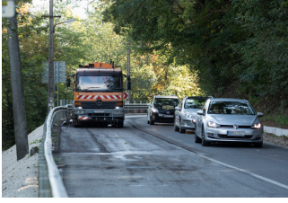
5. septembra cestári odfrézovali ani nie ročný asfalt.

Koncom septembra 2019 sa začalo s opravou Cesty II/499 pod Červenou vežou. V polovici júla tohto roka sa rozbehla sanácia spodnej časti Krajinského mosta. Obe rozsiahle investície boli ukončené v pondelok 14. septembra. Hradil ich vlastník cestnej komunikácie Trnavský samosprávny kraj.