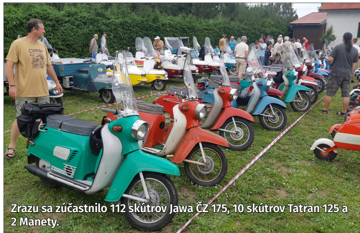
Zrazu sa zúčastnilo 112 skútrov Jawa ČZ 175, 10 skútrov Tatran 125 a 2 Manety.