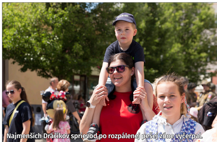
Najmenších Dráčikov sprievod po rozpálenej pešej zóne vycerpal.