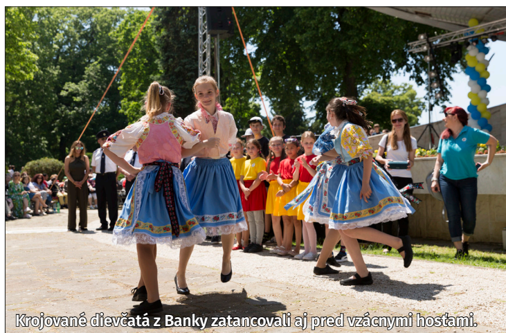
Krojované dievčatá z Banky zatancovali aj pred vzácnymi hosťami.