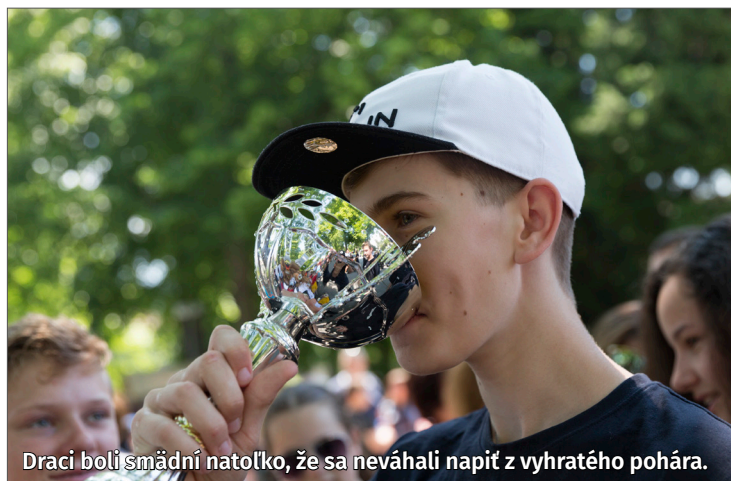
Draci boli smädní natoľko, že sa neváhali napíť z vyhratého pohára.