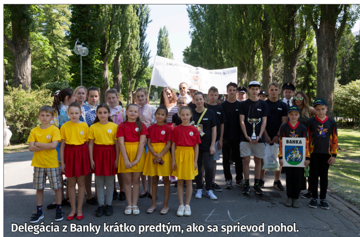
Delegácia z Banky krátko predtým, ako sa sprievod pohol.