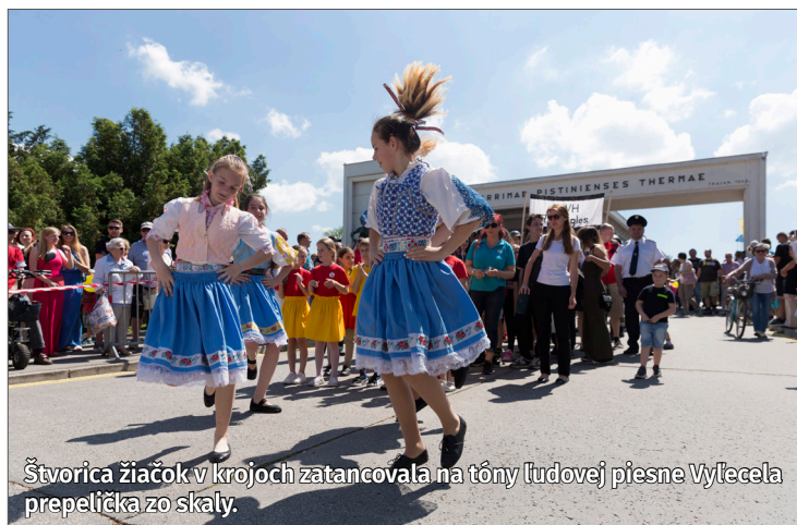
Štvorica žiačok v krojoch zatancovala na tóny ľudovej piesne Vylecela prepelička zo skaly.