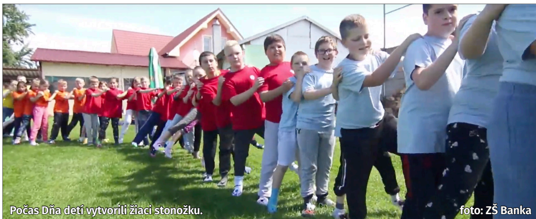
Počas Dňa detí vytvorili žiaci stonožku.

Výlety po Slovensku, motýle na školskom dvore a stonožka na ihrisku – tak by sa dal v skratke zhrnúť uplynulý mesiac v škole.