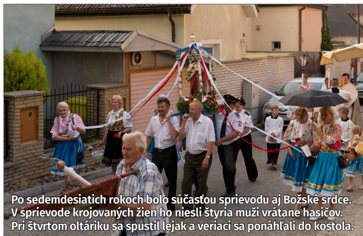
Po sedemdesiatich rokoch bolo súčasťou sprievodu aj Božské srdce. V sprievode krojovaných žien ho niesli štyria muži vrátane hasičov. Pri štvrtom oltáriku sa spustil lejak a veriaci sa ponáhľali do kostola.