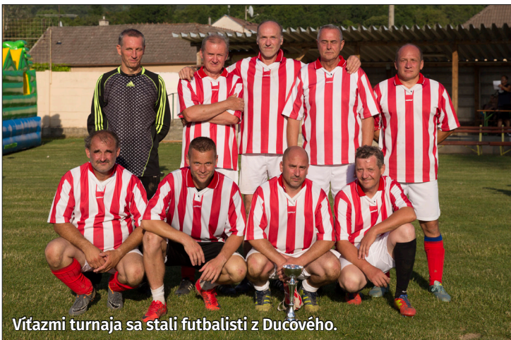
Vítazmi turnaja sa stali futbalisti z Ducového.