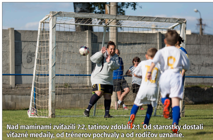
Nad maminami zvíťazili 7:2, tatínov zdolali 2:1. Od starostky dostali víťazné medaily, od trénerov pochvaly a od rodičov uznanie.