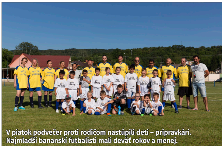
V piatok podvečer proti rodičom nastúpili deti – prípravkari. Najmladší bananskí futbalisti mali deväť rokov a menej.