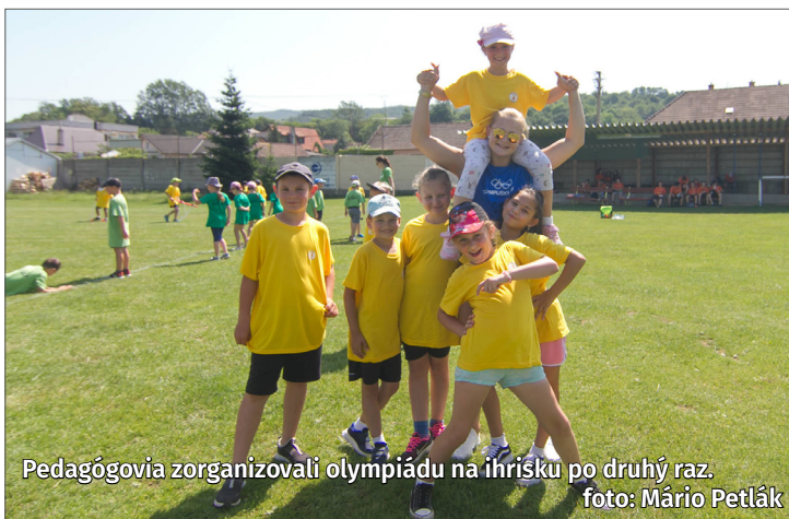
Pedagógovia zorganizovali olympiádu na ihrisku po druhý raz.