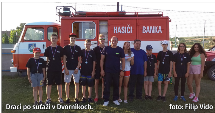
Draci po súťaži v Dvorníkoch.

V sobotu 6. júla pripravili tréneri pre Drakov a Dráčikov nočné premietanie spojené s prespávačkou na futbalovom ihrisku. Dráčikovia prišli spolu s rodičmi. Draci s trénermi sa poďakovali starostke za doterajšiu podporu a obdarovali ju kyticou. Na vozidlo Avia priprenili plátno a premietli si rozprávky, hrané filmy aj dokumenty s hasičskou a športovou tematikou. Pre deti bol pripravený nočný tréning – zapájanie hadíc a člňkový beh v tme – a taktiež plnenie zábavných úloh. Hoci pôvodný zámer bol noc prespať, väčšina detí pozerala film alebo sa rozprávala až do svitania.