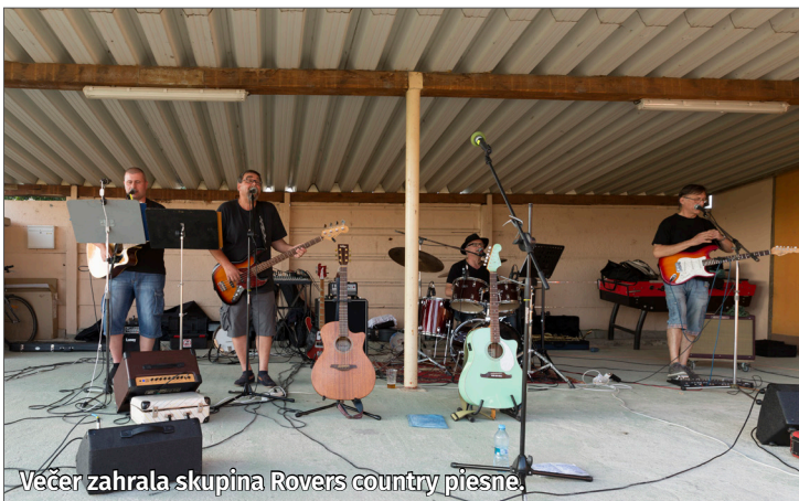
Večer zahrala skupina Rovers country piesne.