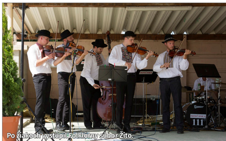
Po žiakoch vystúpil Folklórny súbor Žito.