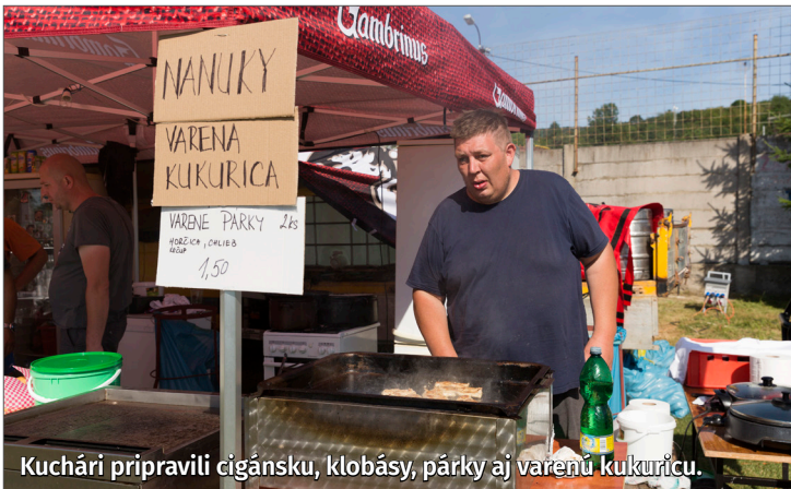
Kuchári pripravili cigánsku, klobásy, párky aj vareňú kukuricu.