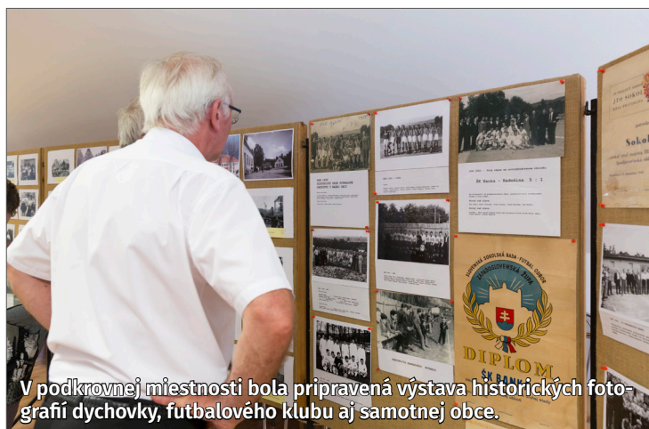
V podkrovnej miestnosti bola pripravená výstava historických fotografií dychovky, futbalového klubu aj samotnej obce.