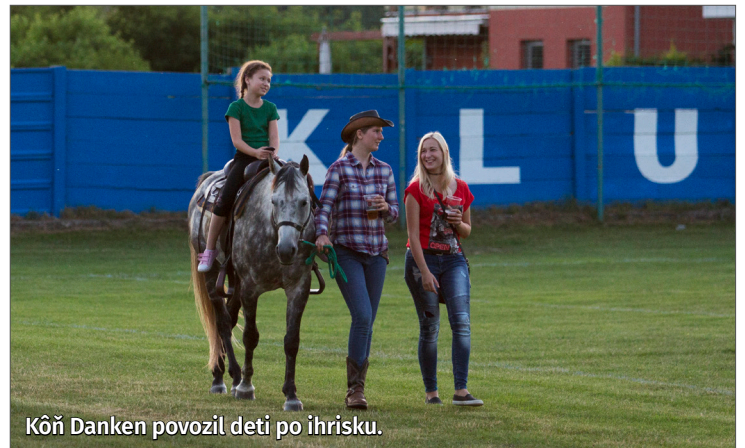
Kôň Danken povozil deti po ihrisku.