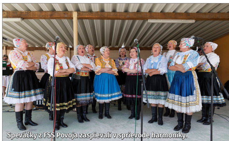
Speváčky z FSS Povoja zaspievali v sprievode harmoniky.