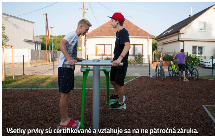
Všetky prvky sú certifikované a vztahuje sa na ne päťročná záruka.