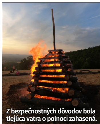
Z bezpečnostných dôvodov bola tlejúca vatra o polnoci zahasená.

Krátko nato vatru zapálili dobrovoľní hasiči. Keďže platí čas zvýšeného rizika vzniku požiaru, počas večera spolu s hasičskou mládežou neustále vykonávali protipožiarne