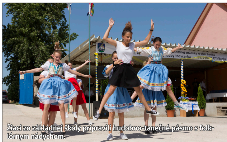
Žiaci zo základnej školy pripravili hudobno-tanečné pásmo s folklórnym nádychom.