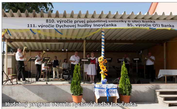
Hudobný program otvorila Dychová hudba Inovčanka.