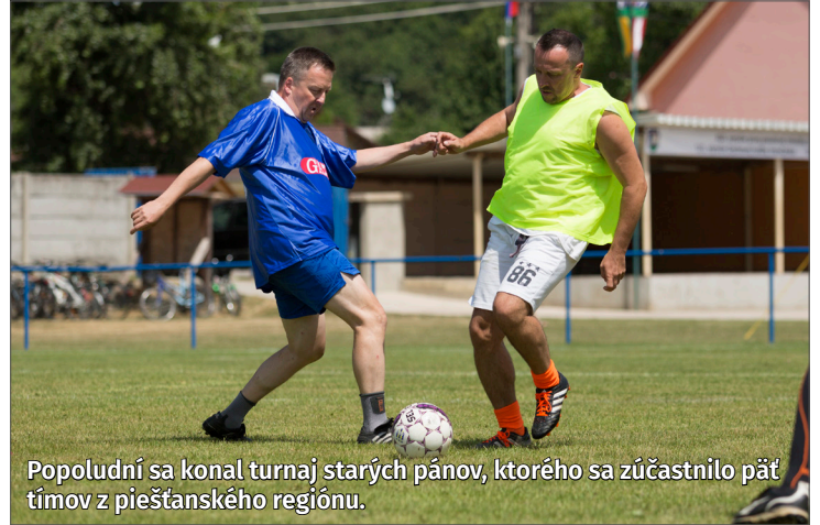
Popoludní sa konal turnaj starých páňov, ktorého sa zúčastnilo päť tímov z piešťanského regiónu.