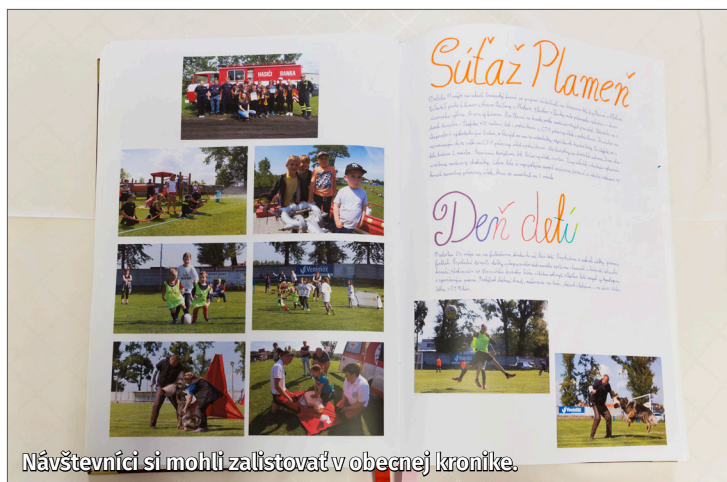
Návštevníci si mohli zalistovať v obecnej kronike.