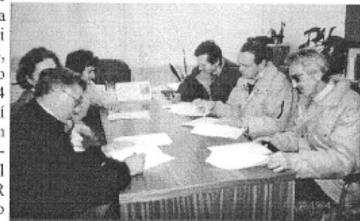
Príprava potrebných materiálov pre vládu SR...

Začiatkom 90-tych rokov spontánne vznikla v mestskej časti Banka občianska iniciatíva, ktorej cieľom sa stalo odčlenenie obce od mesta Piešťany. Skúsenosti sa čerpali z obcí, ktoré sa už osamostatnili, napr. Biely Kostol od Trnavy. Ustanovil sa petičný výbor, ktorý bol poverený zastupovať občanov vtedajšej mestskej časti Banka. Podpisy pod petíciu sa podarilo zozbierať v potrebnom množstve veľmi rýchlo. Na základe petície občanov Banky, ktorá bola odovzdaná primátorovi Piešťan dňa 22.2.1994, mestské zastupiteľstvo prijalo dňa 29.4.1994 uznesenie o vykonaní referenda. Referendum prebehlo v dňoch 20.5.-21.5.1994 a výsledok bol oznámený Vláde SR 7.6.1994 s tým, že bolo platné a rozhodnutie občanov o odčlenení prijaté.