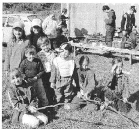
Najväčším účastníkom akcie boli určite deti, ktoré si ju užívali priamym diškom pri opísaní na Aheji.

Slnkom zaliate ráno prilákalo obdivovať krásy okolitej prírody našej obce nielen turistov z Banky, ale aj z Piešťan, Moravian nad Váhom, Vrbového, Lančára, Trnavy, ba aj z Bratislavy. Pochodu sa zúčastnilo 68 turistov, 28 dospelých a 40 detí. Už tradične sa najviac turistov - 42 - vydalo na 10 km trasu. 17 turistov zdolávalo 15 km trasu a na cyklotrasu dlhú 30 km sa vydalo 9 cykloturistov.