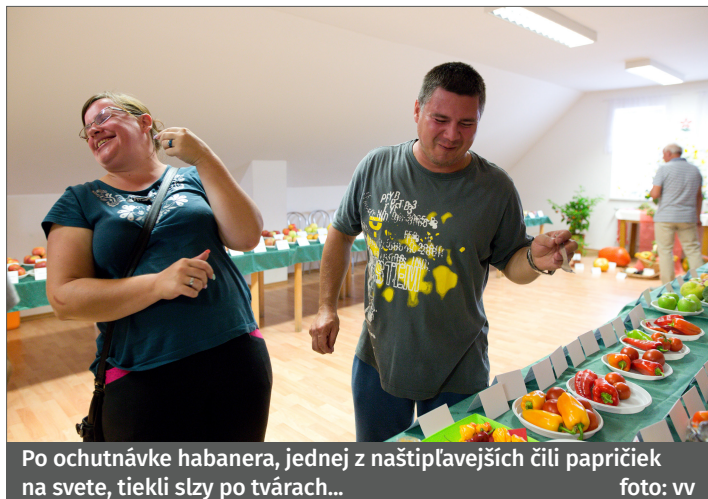
Po ochutnávke habanera, jednej z naštipľavejších čili papričiek na svete, tiekli slzy po tvárach...