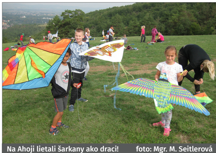
Na Ahoji lietali šarkany ako draci!

V pondelok 3. septembra sa znova otvorili brány školy.