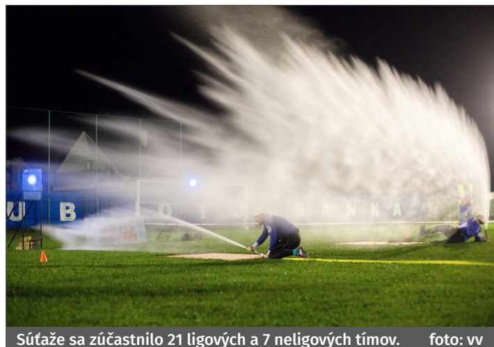
Súťaže sa zúčastnilo 21 ligových a 7 neligových tímov.