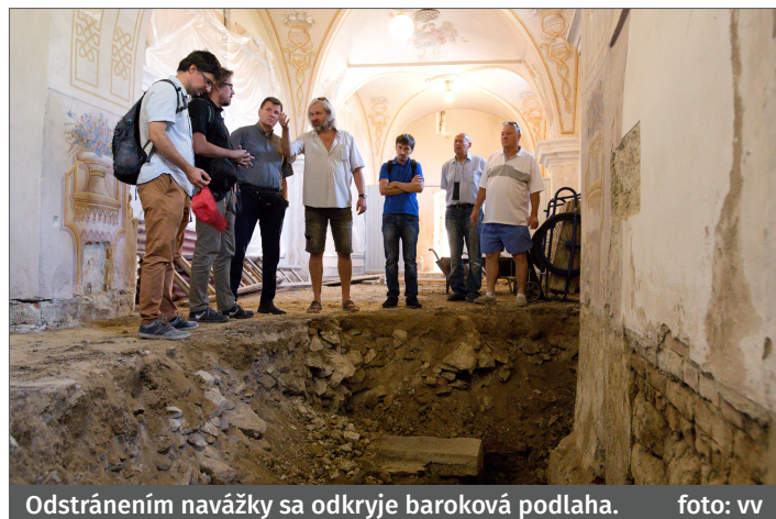
Odstránením navážky sa odkryje baroková podlaha.