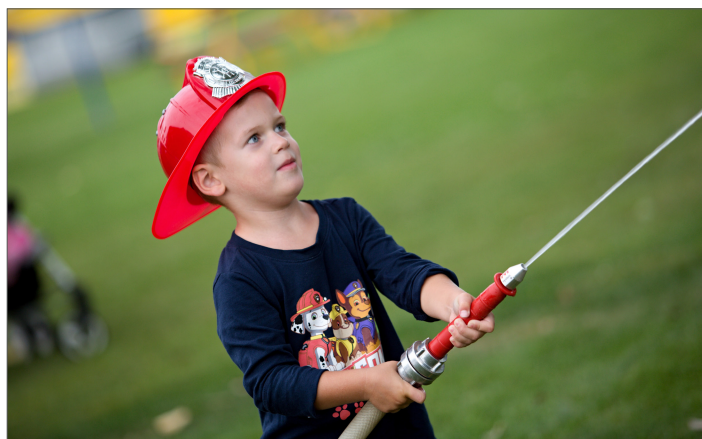
Počas ukážok spravili bananskí hasiči aj nábor detí.