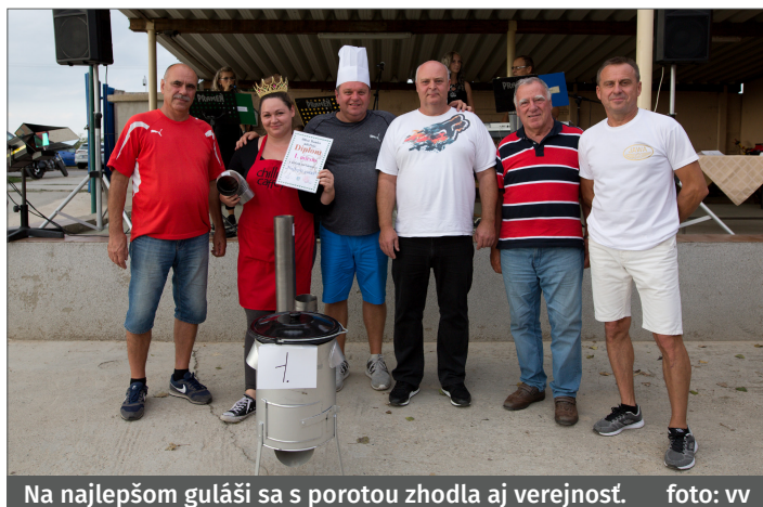
Na najlepšom guláši sa s porotou zhodla aj verejnosť.