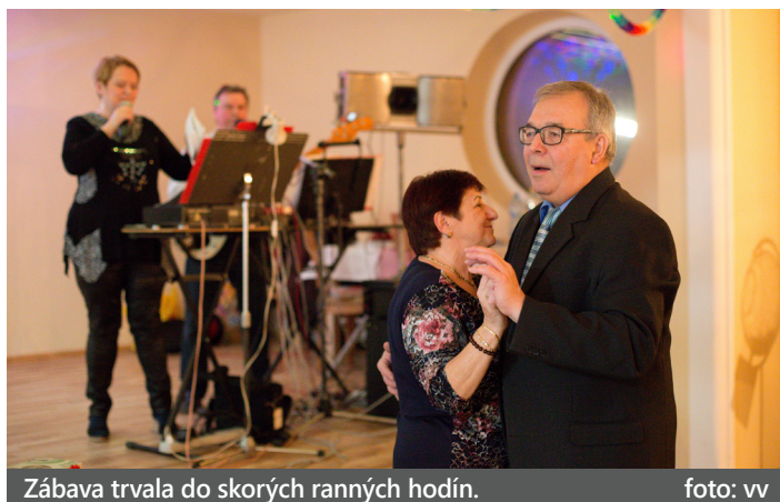
Zábava trvala do skorých ranných hodín.

Fašiangami nazývame obdobie od Troch kráľov do Popolcovej stredy. Sú prechodom medzi