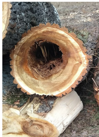
Pohľad na spílené topole v priereze prezrádza o ich stave veľa.