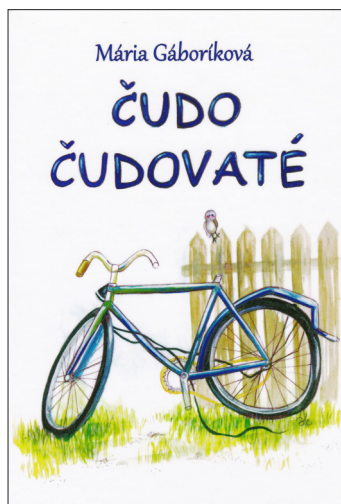
Obe knižky zdobia ilustrácie z vidieckeho prostredia.