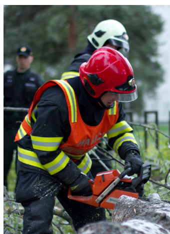
Len v minulom roku zavalili dreviny štyri osobné autá.

vôbec. Až keď sa v minulom roku prvýkrát zrútil odlomený konár na zaparkované auto a o pár mesiacov neskôr na ďalšie tri autá, veci sa dali aj na podnet spoluobčanov a televízie do pohybu. SLK zabezpečili orez svojich stromov a Ope-