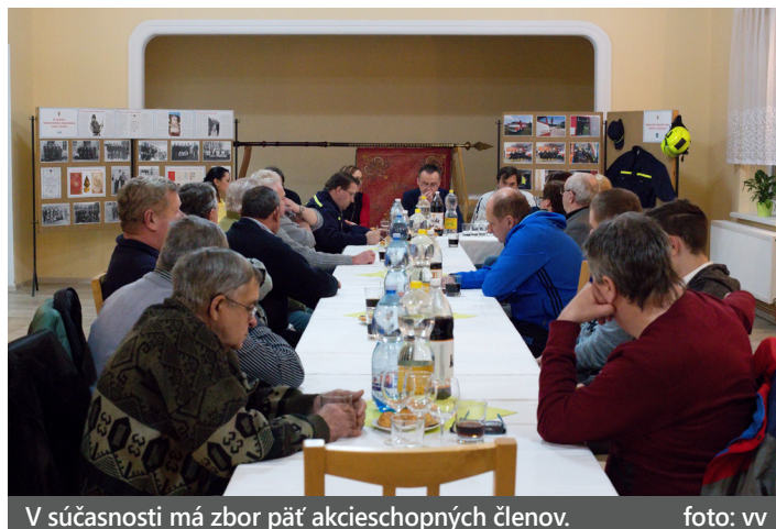
V súčasnosti má zbor päť akčioschopných členov.