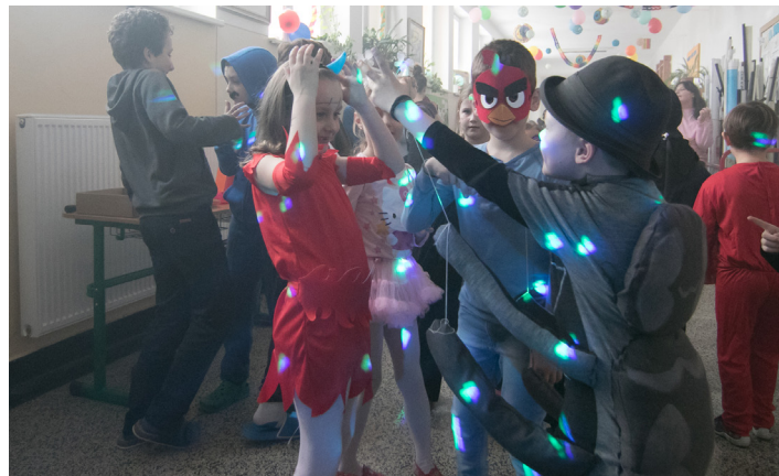
Deti prišli na karneval s najroznejšími maskami na tvárach.