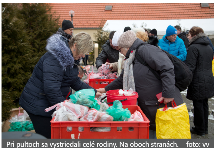
Pri pulloch sa vystriedali celé rodiny. Na oboch stranách.

V sobotu 17. februára dopoludnia sa na námestí pred škôlkou uskutočnila obľúbená fašiangová zabíjačka. Podujatie si tento rok pod patronát vzal obecný úrad. Čerstvé mäsové výrobky z jedného celého prasiatka a troch poloviciek sa rýchlo rozpredali.