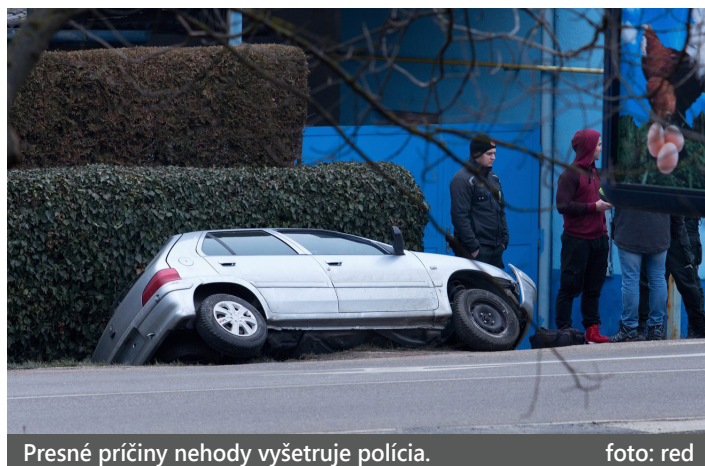
Presné príčiny nehody vyšetruje polícia.