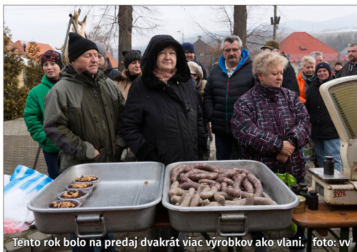
Tento rok bolo na predaj dvakrát viac výrobkov ako vlani.