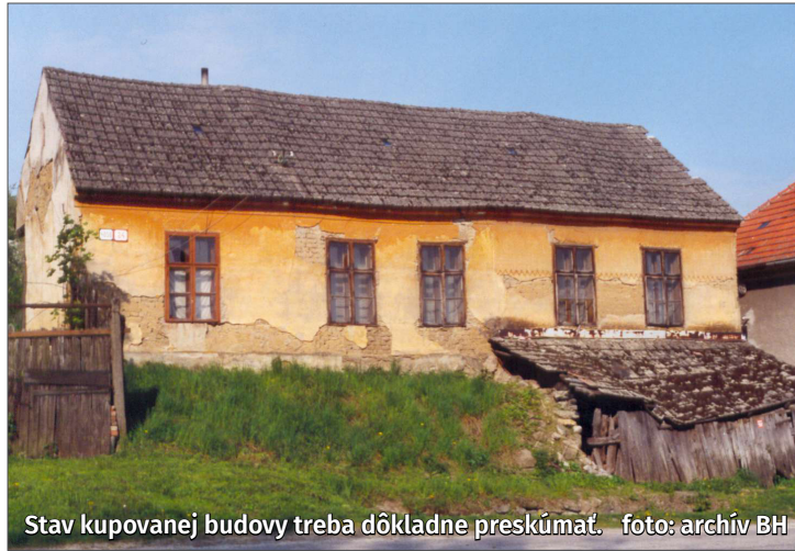
Stav kupovanej budovy treba dôkladne preskúmať.

Neobmedzujte sa len na hodnotenie „páči sa – nepáči sa“ či „drahé – lacné“. Taktiež treba myslieť na to, že po kúpe môže byť vyžadovať investície. Preto by ste sa mali pýtať na technický stav rozvodov, stúpačiek, výťahu, strechy, zateplenia; zistiť si energetický certifikát budo-