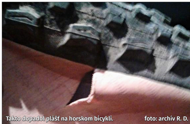
Takto dopadol plášť na horskom bicykli.