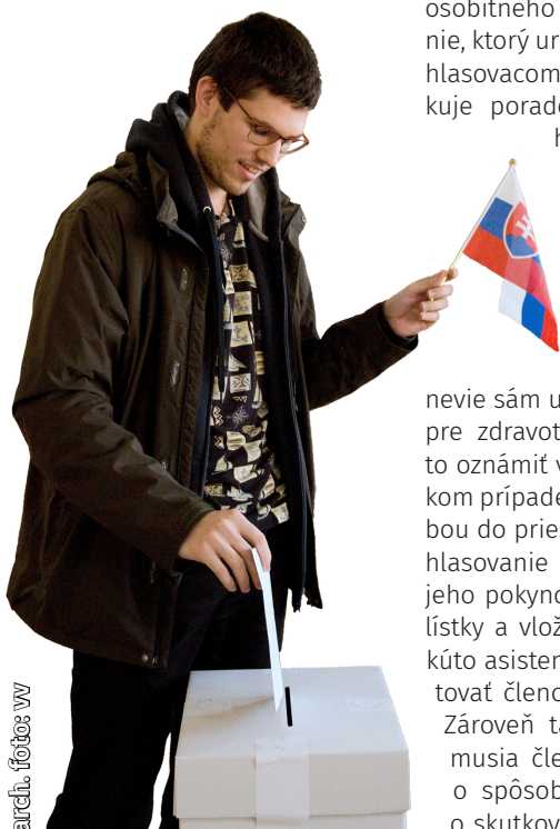
airca, fotos: vv