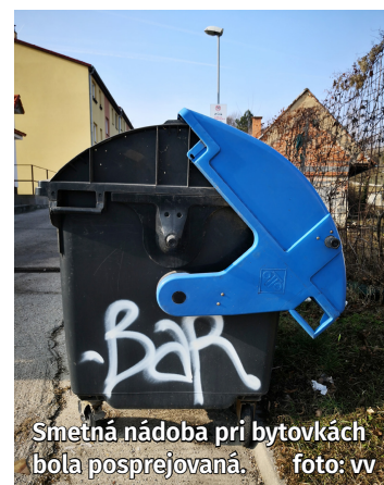
Smetná nádoba pri bytovkách bola posprejovaná.