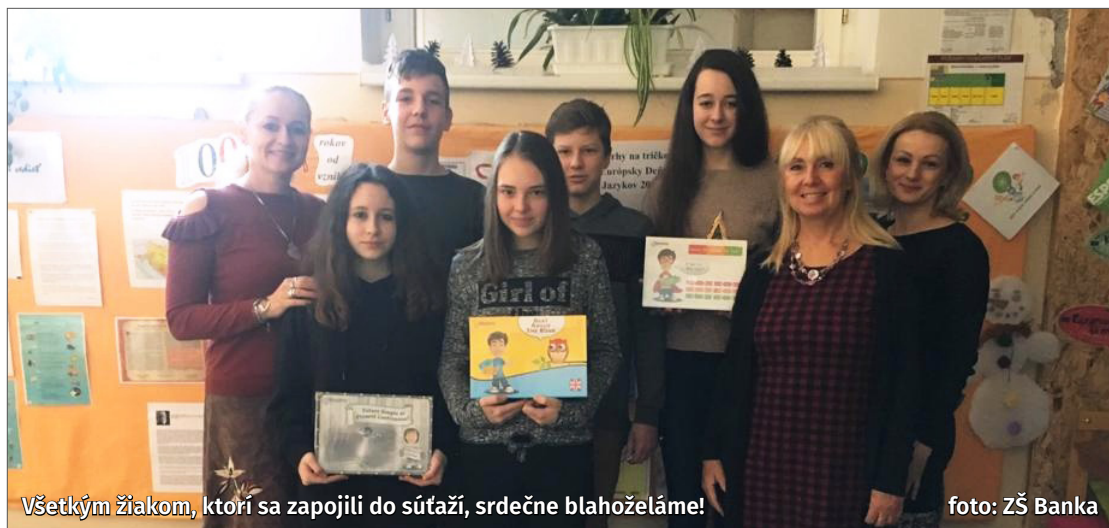
Všetkým žiakom, ktorí sa zapojili do súťaží, srdečne blahozeláme!

Základnú školu zviditeľnili naši žiaci hlavne vďaka vedomostným súťažiam.