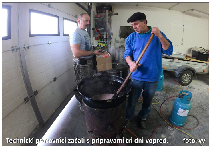
Technickí pracovníci začali s prípravami tri dni vopred.