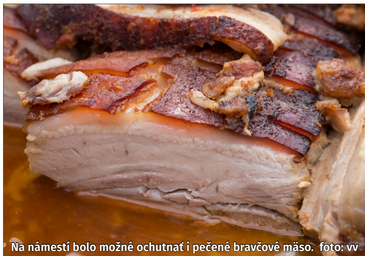
Na námestí bolo možné ochutnať i pečené bravčové mäso.