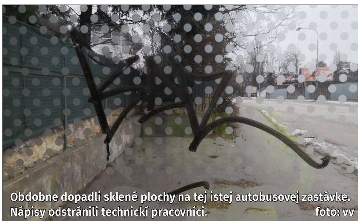
Obdobne dopadli sklené plochy na tej istej autobusovej zastávke. Nápisy odstránili technickí pracovníci.