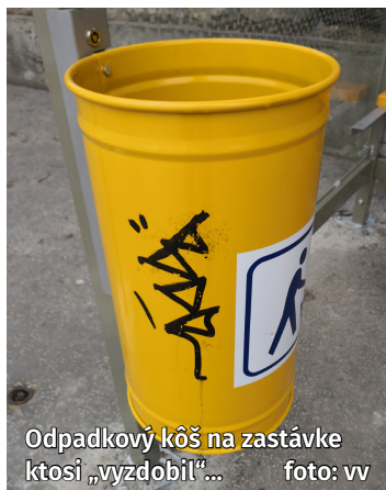
Odpadkový kôš na zastávke ktosi „vyzdobil“...

V posledný januárový týždeň nám bol nahlásený popísaný obecný majetok v rôznych častiach Banky. Vyčiniť vandala či vandalov sa nevyhla autobusová zastávka na Ceste Janka Alexyho ani smetná nádoba na Topoľčianskej ceste. Autor zanechal za sebou nápisy „BAR“.