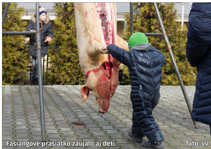
Fašiangové prasiatko zaujalo aj deti.