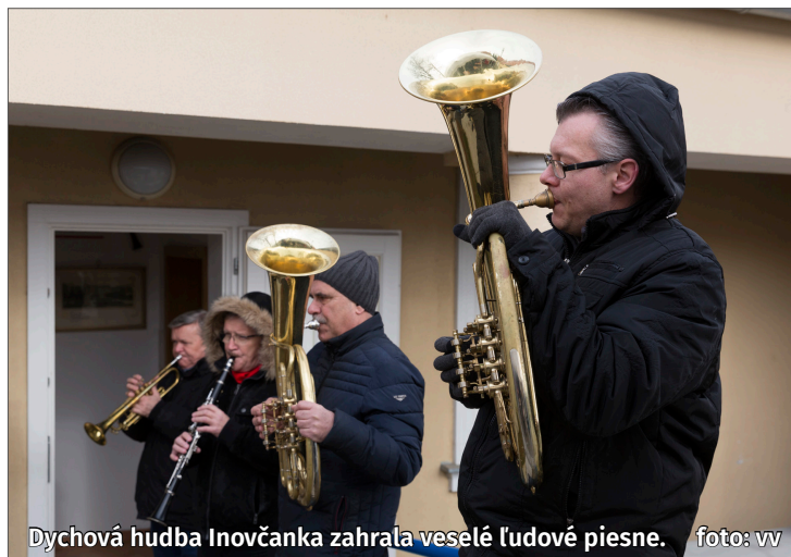
Dychová hudba Inovčanka zahrala veselé ľudové piesne.