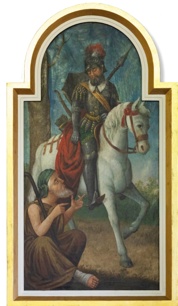
Príbeh o sv. Martinovi na maľbe v kostole