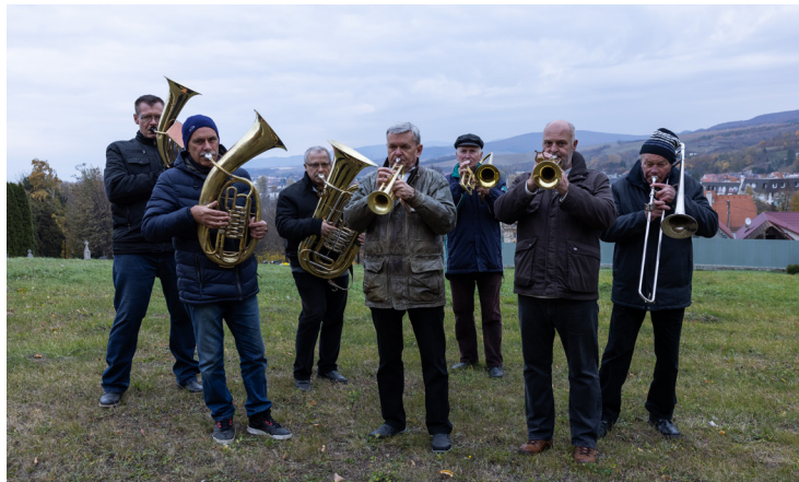
Dychová hudba zahrala smútočné piesne v spodnej časti cintorína.