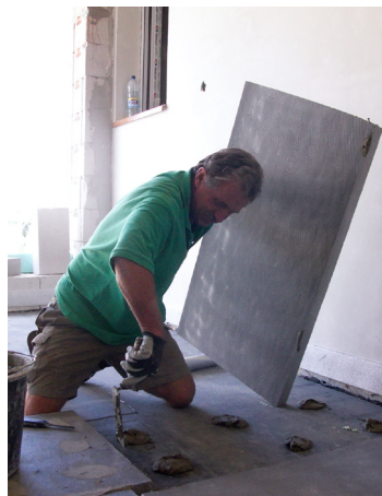
| ilustr. foto: vv

Akcia bude trvať do polovice roku 2026. Týka sa iba domov starších ako 15 rokov. Na budúci rok budú zverejnené parametre výzvy,