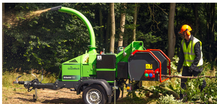
Obec zakúpi štiepkovač na spracovanie drevnateho bioodpadu.

správu nezávislého audítora ku konsolidovanej účtovnej závierke