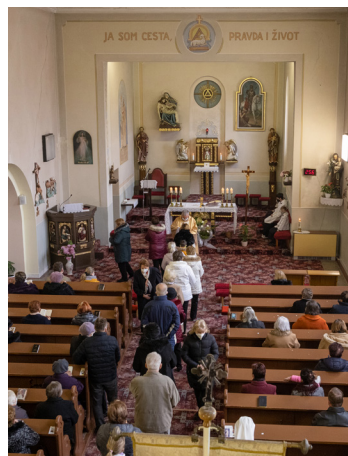
Veriaci museli nosiť respirátory.

Sv. Martin z Tours spolu so žobrákom vyobrazený na erbe našej obce, ktorý vychádza z obecnej pečate z roku 1720. Sv. Martin je znázornený v podobe husára. Sedí so šablou na koni a pred ním stojí žobrák opretý o palicu.