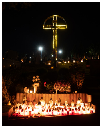
Okolie kríža zaplnili horiace sviečky.