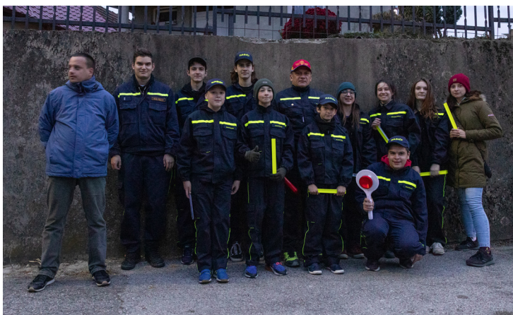
Miestni hasiči rozdávali reflexné prvky od roku 2018.