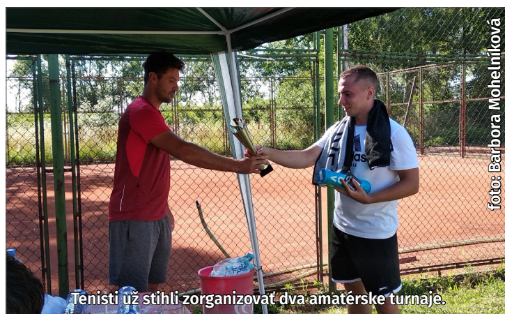
Tenisti už stihli zorganizovať dva amatérske turnaje.

Šéfredaktor, fotograf, grafik a autor hlavolamov: Viktor Vrábek