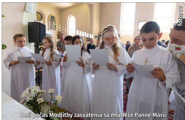
Deti počas Modlitby zasvätenia sa mládeže Panne Márii.