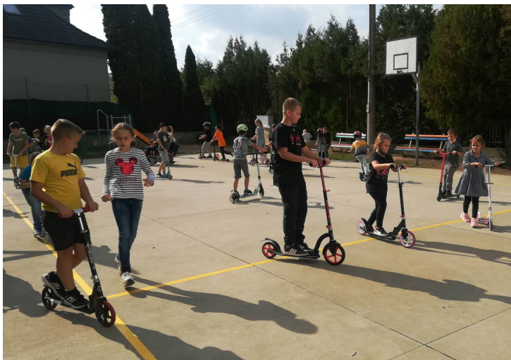
Prvostupniari sa zabavili na kolobežkách.

Povinné nosenie rúšok sa stalo bežnou rutinou aj pre žiakov prvého stupňa. Niektoré deti si už zvykli, no všetci sa tešíme na dobu, keď rúška už nebudeme potrebovať vôbec.