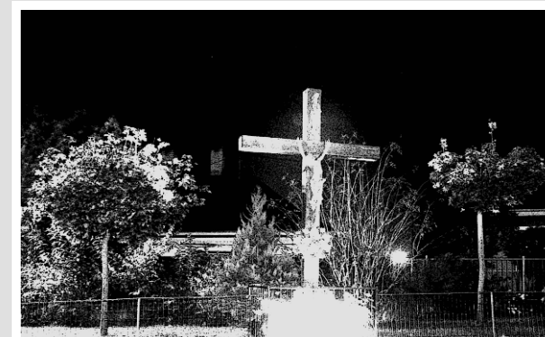
NOVEMBROVÁ NOSTALGIA Z BANKY...