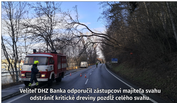
Veliteľ DHZ Banka odporučil zástupcovi majiteľa svahu odstrániť kritické dreveniny pozdĺž celého svahu.