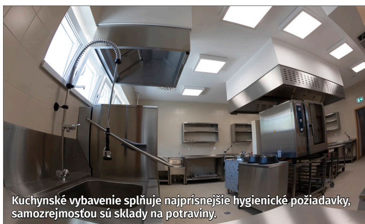
Kuchynské vybavenie spĺňa najprísnejšie hygienické požiadavky, samozrejmosťou sú sklady na potraviny.