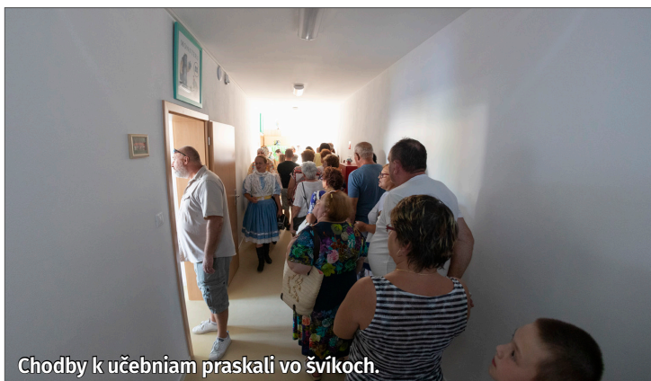
Chodby k učebniam praskali vo švíkoch.

V sobotu 1. septembra predstavitelia našej obce, základnej školy a delegácia z Trnavského samosprávneho kraja (TTSK) slávnostne otvorili nový komplex v areáli školy, ktorý zahŕňa telocvičňu, tri triedy materskej školy, tri učebne, kuchyňu s jedálňou a príslušné priestory. Po slávnostnom prestrihnutí pásky o tretej hodine popoludní si mohla verejnosť prehliadnúť nové priestory.