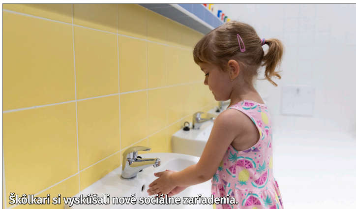
Škôlkari si vyskúšali nové sociálne zariadenia.