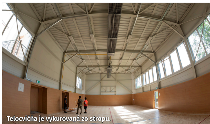
Telocvičňa je vykurovaná zo stropu.