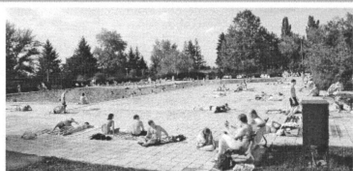
Sĺňava uprostred sezóny 2005...

Keď som sa spýtal kolegu, kam sa chystá toto leto na dovolenku, dozvedel som sa, že ide s deťmi na dva týždne do Štúrova, že je tam nádherné termálne kúpalisko... Vtedy mi myslou prebehlo: „Kde sú tie zlaté staré časy, keď Sĺňava bol pojem nielen na Slovensku...?“ A je to fakt! Keď sa mnohé oblasti rozmáhajú, Sĺňava upadá... Príkladom môže byť Aquapark