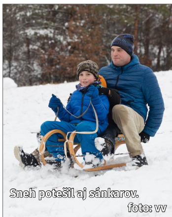
Sneh potešil aj sánkarov.