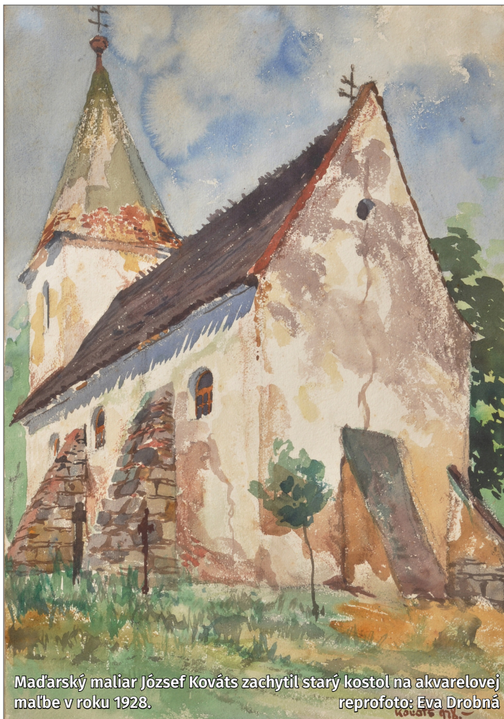
Maďarský maliar József Kovács zachytil starý kostol na akvarelovej reprofoto: Eva Drobná

Kostol na Banke v stredoveku plnil funkciu farského kostola s výsadou pochovávaní na príslušnom cintoríne a aj v jeho interiéri. Počas výskumu sme odkryli viacero hrobov vrátane hrobu novorodenca pochovaného tesne pri vonkajšej stene kostola. Zaujímavosťou boli stredoveké hroby v interiéri uložené v smere sever-juh a nie, ako to bývalo obvyklé, v smere východ-západ.