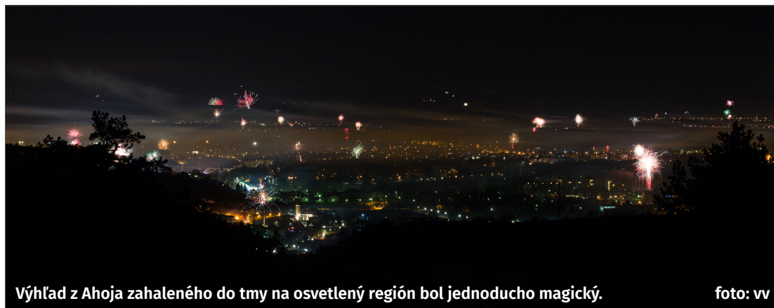
Výhľad z Ahoja zahaleného do tmy na osvetlený región bol jednoducho magický.