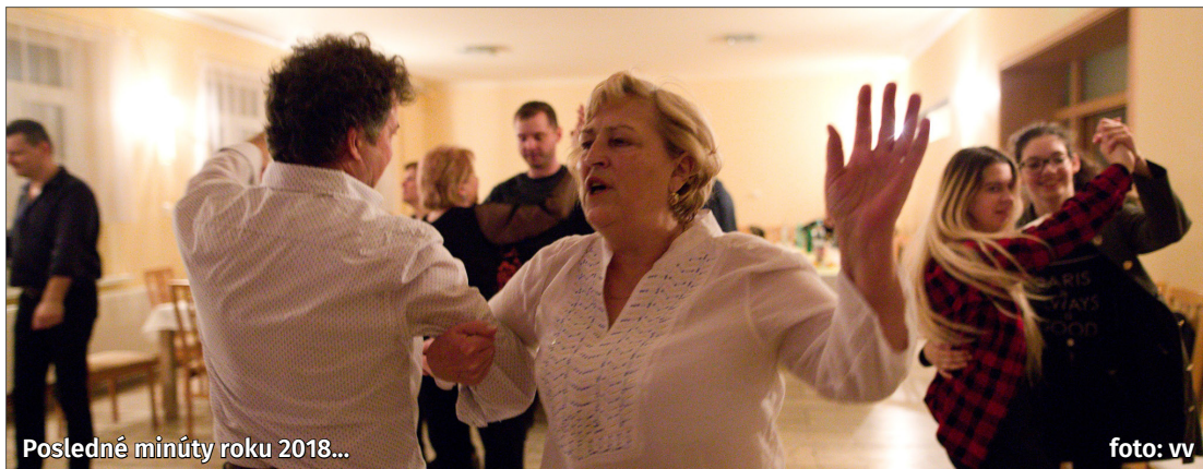
Posledné minúty roku 2018...