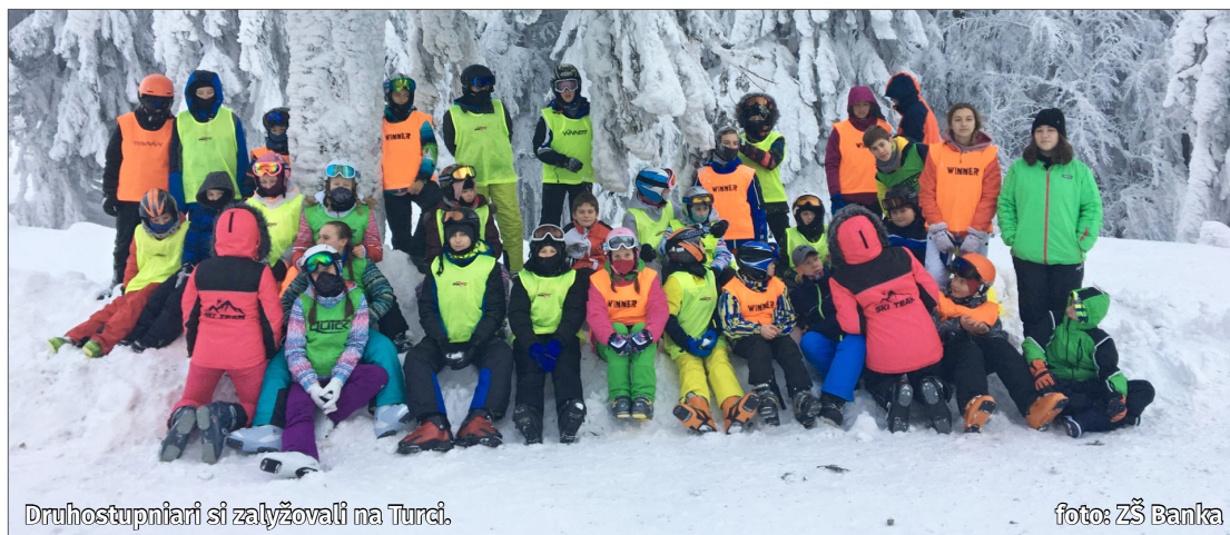
Druhostupniari si zalyžovali na Turci.

Začiatok roka 2019 sa v našej základnej škole niesol v znamení lyžovania.