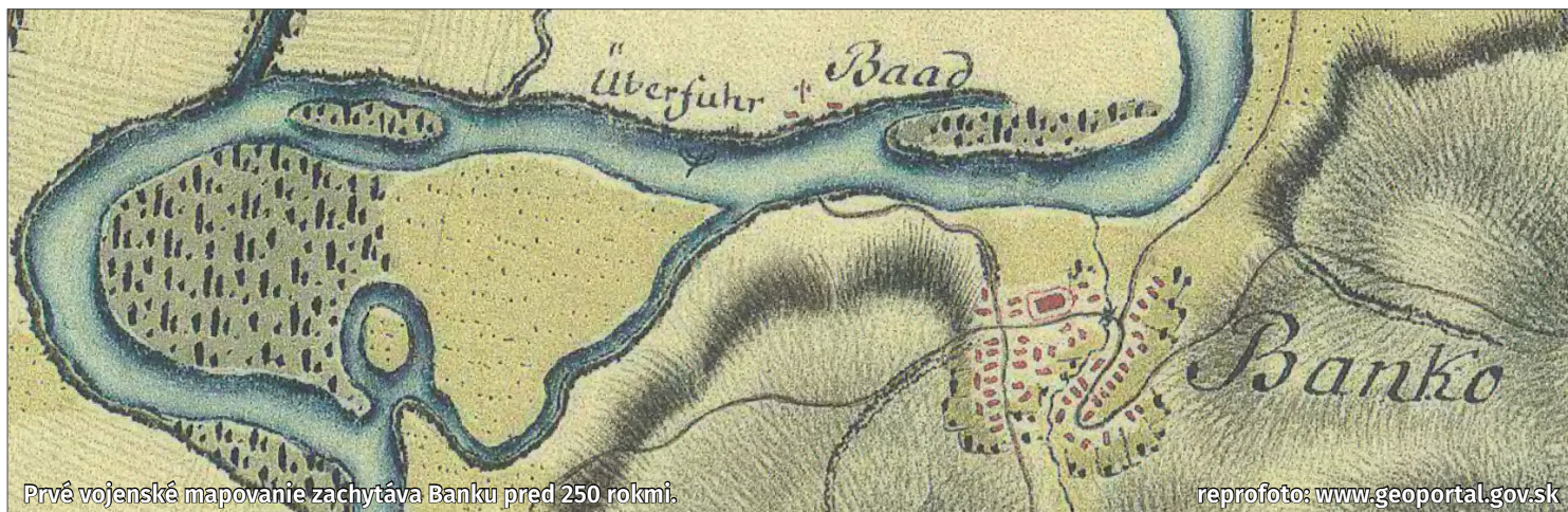
Prvé vojenské mapovanie zachytáva Banku pred 250 rokmi.