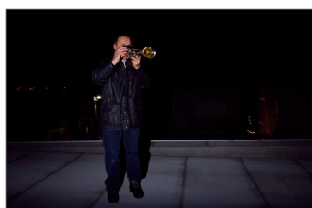
Tichá noc znela z každej strany