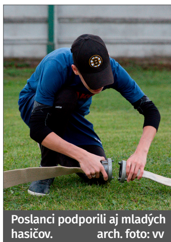
Poslanci podporili aj mladých hasičov.