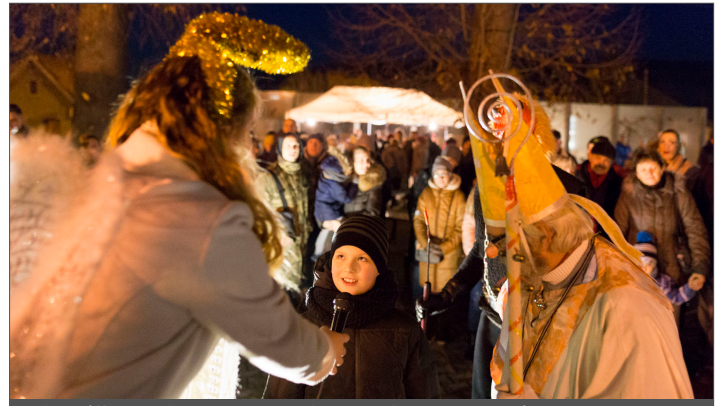
Mikulášske trio svedčalo jedno dieťa za druhým.

Krátku zimnú choreografiu predviedli žiaci prvého stupňa, ktorých vystriedali staršie deti s veršovankami. Dychová hudba Inovčanka zahrála sériu ľudových piesní. Horúcu kapustnicu pripravili a podávali technickí pracovníci