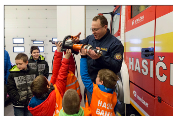
Draci a Dráčikovia navštívili hasičov v okolí