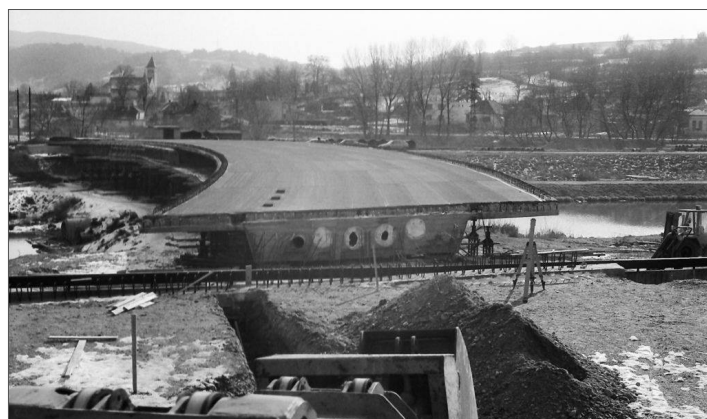
Výstavba Kúpeľného mosta v roku 1993. V pozadí vidno starú Banku s tyčiacou sa vežou nového kostola.