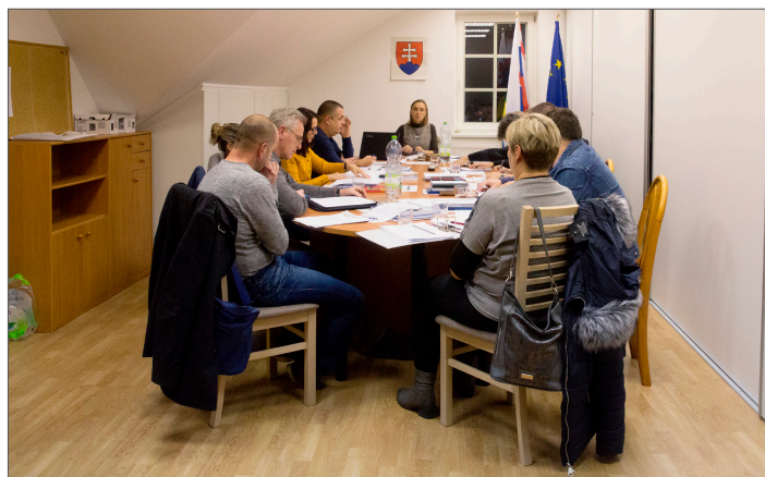
Obecné zastupiteľstvo prerozdeľovalo obecným organizáciám dotácie na rok 2019.

Mladých hasičov DHZ Banka vo výške 2 000 € na rok 2019