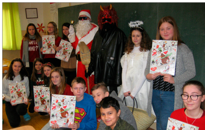
Aj do školy zavítal Mikuláš.