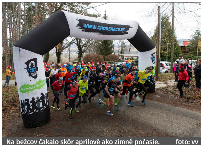
Na bežcov čakalo skôr aprílové ako zimné počasie.