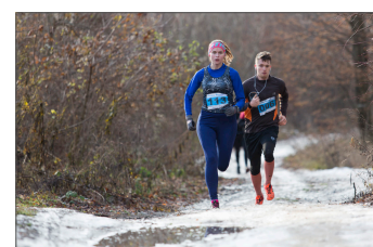
Rolníčkový beh priniesol výborné časy