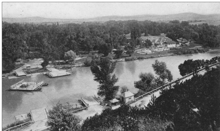
Pohľad z Červenej veže na mŕtve rameno Váhu s kompu zo začiatku 20. storočia. Hotel Thermia Palace vtedy ešte nestál.