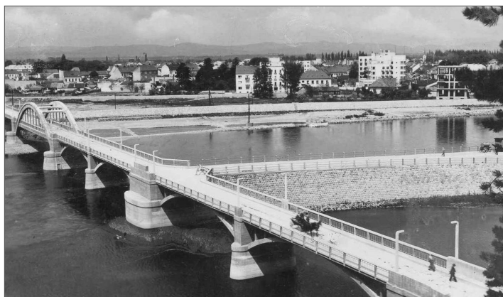
Krajinský most po dokončení v roku 1933. Platanová alej smerujúca k hotelu Thermia Palace ešte nie je vysadená.