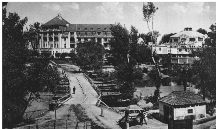
Kompu v 20. rokoch nahradil pontónový most, ktorý ústil za hotelom Thermia Palace. Snímka vznikla koncom 20. rokov.