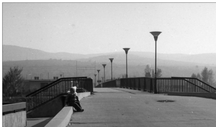
Spojenie Dominovej aleje a Kúpeľného ostrova zabezpečuje železobetónový most už celé desaťročia. Pohľad je zo 70. rokov.