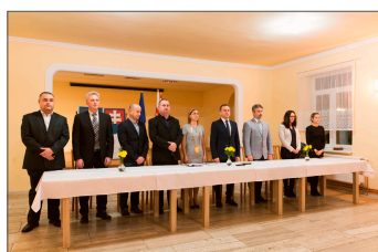
Starostka a poslanci zložili sľub