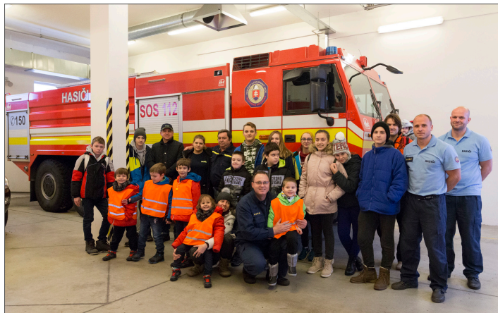
Piešťanskí hasiči zodpovedali každú detskú otázku a tiež deťom dovolili posediť si v kabíne prvovýjazdového vozidla.