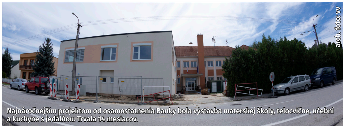
Najnáročnejším projektom od osamostatnenia Banky bola výstavba materskej školy, telocvične, učebni a kuchyne s jedálňou. Trvala 14 mesiacov.

Na začiatku nového roka sa skúsme obzrieť späť do roku uplynulého, roku 2019. Nastal čas zhodnotiť ciele a plány, ktoré sme si na začiatku roka 2019 dali a podarilo sa nám ich uskutočniť, ale i tie, ktoré sme nestihli z rôznych objektívnych dôvodov zrealizovať. Aj pri najväčšom úsilí sa niektoré aktivity z časového i finančného hľadiska presunuli do roku začínajúceho. Zamýšľame sa na svojimi rozhodnutiami a plánujeme ďalšie aktivity, ciele, ktoré by sme chceli v roku 2020 uskutočniť.