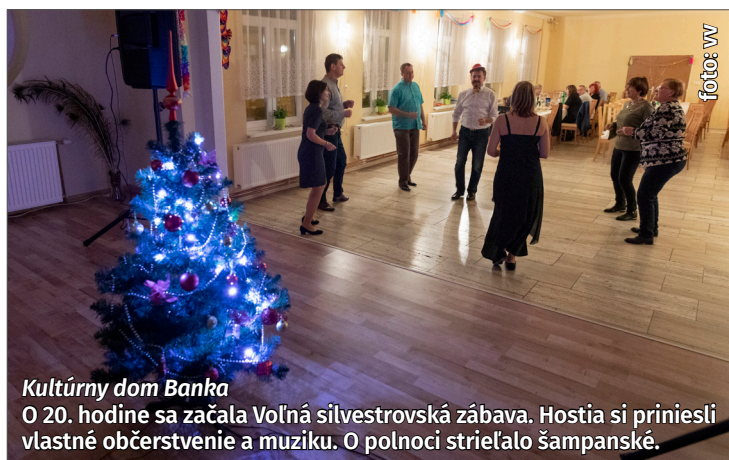
Kultúrny dom Banka O 20. hodine sa začala Voľná silvestrovská zábava. Hostia si priniesli vlastné občerstvenie a muziku. O polnoci strieľalo šampanské.