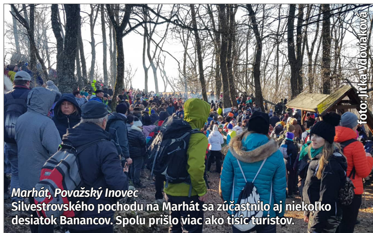
Marhát, Považský Inovec Silvestrovského pochodu na Marhát sa zúčastnilo aj niekoľko desiatok Banancov. Spolu prišlo viac ako tisíc turistov.

Pred mesiacom celý svet oslavoval príchod nového roka. Ako privítali rok 2020 Bananci?