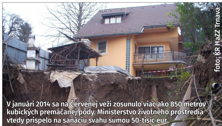
V januári 2014 sa na Červenej veži zosunulo viac ako 850 metrov kubických premáčajanej pôdy. Ministerstvo životného prostredia vtedy prispelo na sanáciu svahu sumou 50-tisíc eur.

Vplyvom klimatických zmien sa v posledných rokoch stále častejšie objavujú silné lokálne búrky s prívalovými dažďami. Pri búrkach a prívalových dažďoch dochádza ku škodám na majetku obyvateľov – zaplavenie