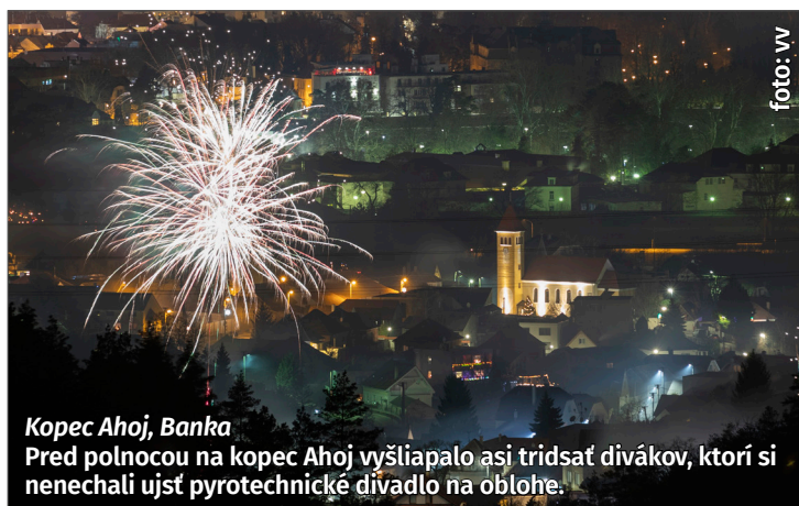
Kopec Ahoj, Banke Pred polnocou na kopec Ahoj vyšliapalo asi tridsať divákov, ktorí si nechali ujsť pyrotechnické divadlo na oblohe.