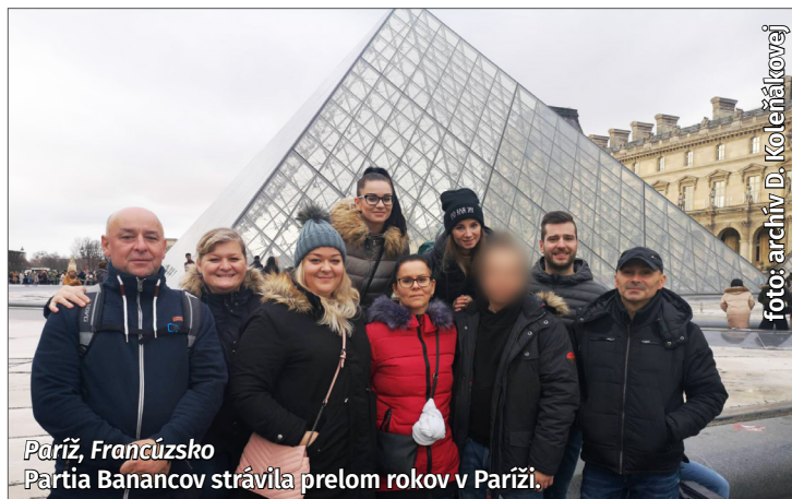
Paríž, Francúzsko Partia Banancov strávila prelom rokov v Paríži.