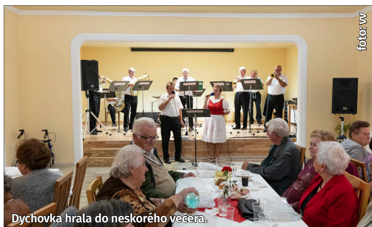
Dychovka hrála do neskorého večera.

S prvými tónmi Dychovej hudby Inovčanka začali na parkete pribúdať tancujúce páry. Darom pre seniorov bolo aj najnovšie hudobné CD bananskej dychovky nazvané Inovčanka 111. Ľudové piesne si vypočuli pri pohári vína, pripravené boli aj obložené chlebíčky, pagáče a niekoľko druhov štrúdle. vv