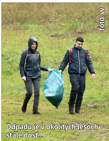
Odpadu je v okolitých lesoch stále dosť...