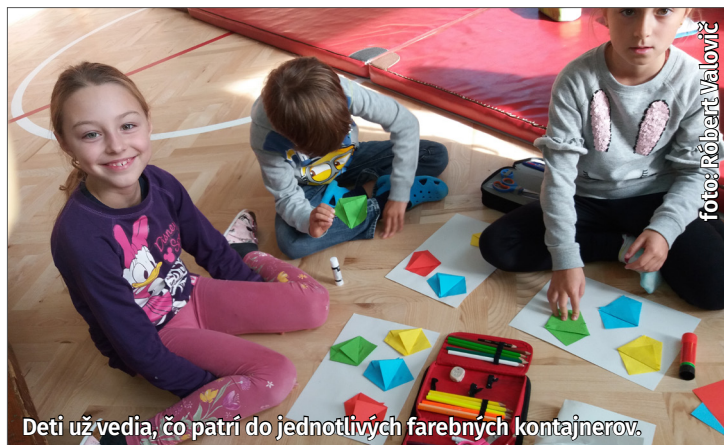
Deti už vedia, čo patrí do jednotlivých farebných kontajnerov.