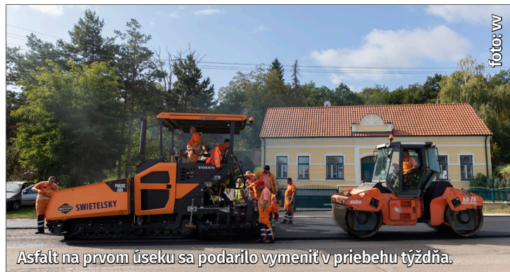
Asfalt na prvom úseku sa podarilo vymeniť v priebehu týždňa.

nadväzuje na prvý a napája sa na Krajinský most, spustili 16. októbra.