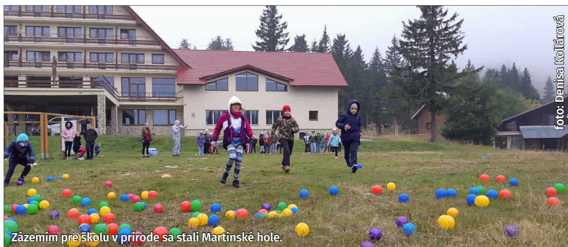
Zázemím pre školu v prírode sa stali Martinské hole.

Naši školáci počas vyučovania nesedia len v laviciach. Aj začiatok jesene bol plný aktivít.