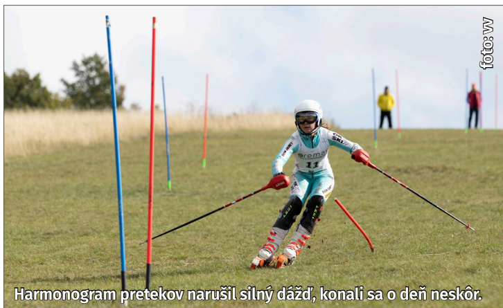
Harmonogram pretekov narušil silný dážď, konali sa o deň neskôr.