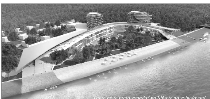
Takto by to malo vyzerať na Sĺňave po vybudovaní.

Upozorňujeme občanov, ktorí v tomto roku napriek upomienkam neuhradili daň za nehnuteľnosť, daň za psa a poplatok za komunálny odpad, že uvedené nedoplatky budú po novom roku postúpené exekútorovi na exekučné konanie.